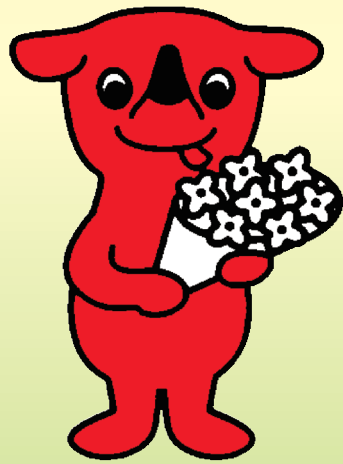
千葉県マスコットキャラクター チーバくん